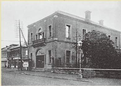
明治22年当時の市役所

明治21年(1888年)に「市制」という法律が制定されました。「市制」は翌明治22年4月1日に施行され、この日、横浜市を含む31の「市」が誕生しました。この「市制」の中で、市には「市会」を置くことと定められていたため、当時は全ての市が「市会」と呼んだのです。その後、昭和22年(1947年)に地方自治法が公布され、市の議会のことには「市議会」と呼ぶことになるのですが、横浜、名古屋、京都、大阪、神戸の5市は、それまでどおり「市会」という呼称を使用し、現在に至っています。